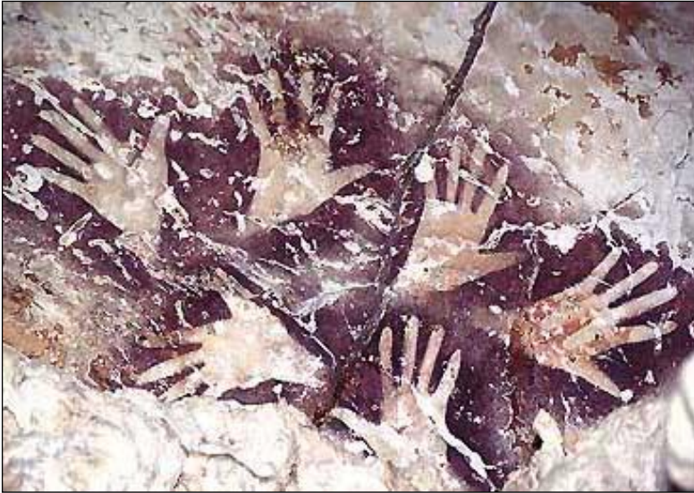
1-Bornéo, d'après J.- M. Chazine et L.-H. Fage.

Elle est parfois positive, c'est-à-dire que la couleur est apposée d'abord sur la main, qui fait office de tampon mais, dans une grande majorité de cas, elle est négative. Dans ce cas, elle sert de pochoir, et la couleur est projetée avec une sorte d'aérographe ou à l'aide d'un pinceau. Parfois seule, parfois associée à d'autres ou des figures animalières, on la retrouve partout, à toutes les époques, et l'on peut se demander si ce n'est pas le premier « signe » de l'Humanité ?