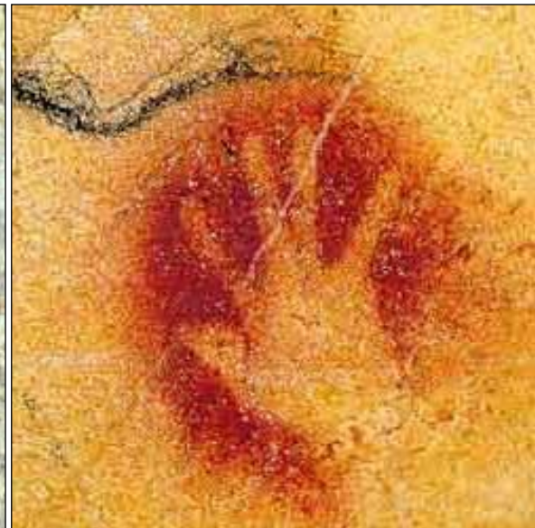
2-Grotte Chauvet – Pont-d'Arc, Vallon-Pont-d'Arc, Ardèche.