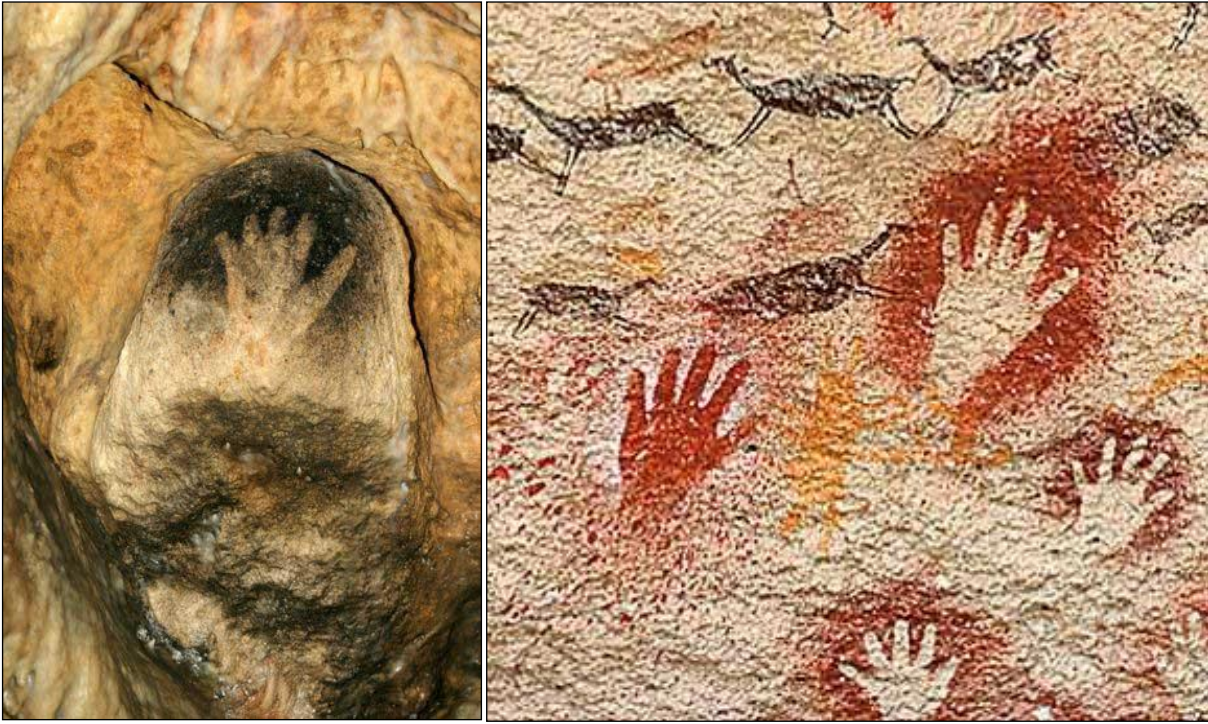
1-Grotte de Gargas, Aventignan, Hautes-Pyrénées.