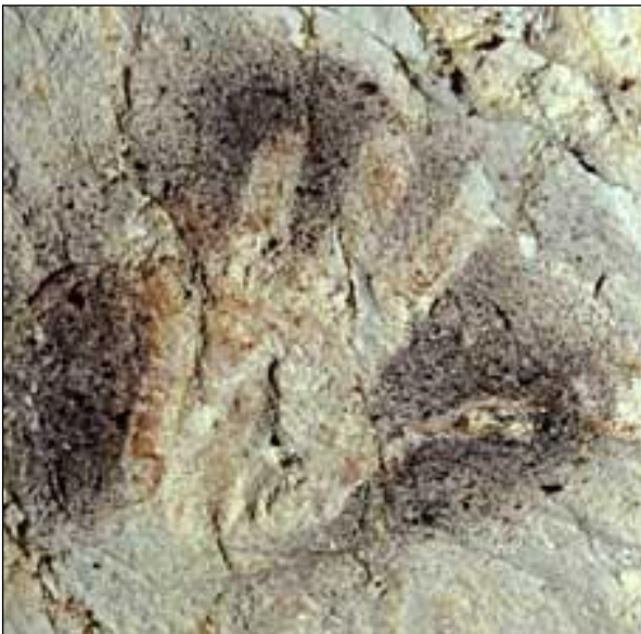
1-Grotte Cosquer, Marseille, Bouches-du-Rhône.